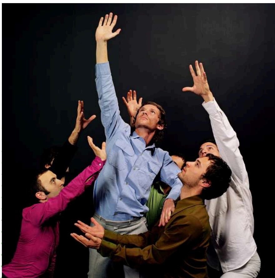
RUGBY, Édouard Levé (série photographique)

L'atelier sera l'occasion d'enregistrer les voix des usagers du restaurant, nous racontant leurs souvenirs lointains ou récents d'activités qu'ils auraient pratiqués au cours de leur vie. Qu'il s'agisse d'athlétisme ou de danse, de cyclisme ou de marche nordique, de ping-pong ou d'haltérophilie, chacun partagera son expérience face au micro et face aux autres. Un temps privilégié d'échange et d'écoute, pour se souvenir et parler de soi. Chaque histoire partagée ouvrira une fenêtre sur la vie de celui qui la raconte, permettant aux autres participants de mieux se connaître et de tisser des liens plus profonds au sein de la communauté du restaurant.